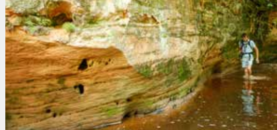
Vasarā var iet pa upi