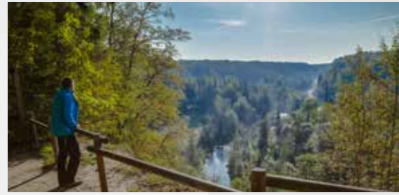
Skats no Ainavu kraujas